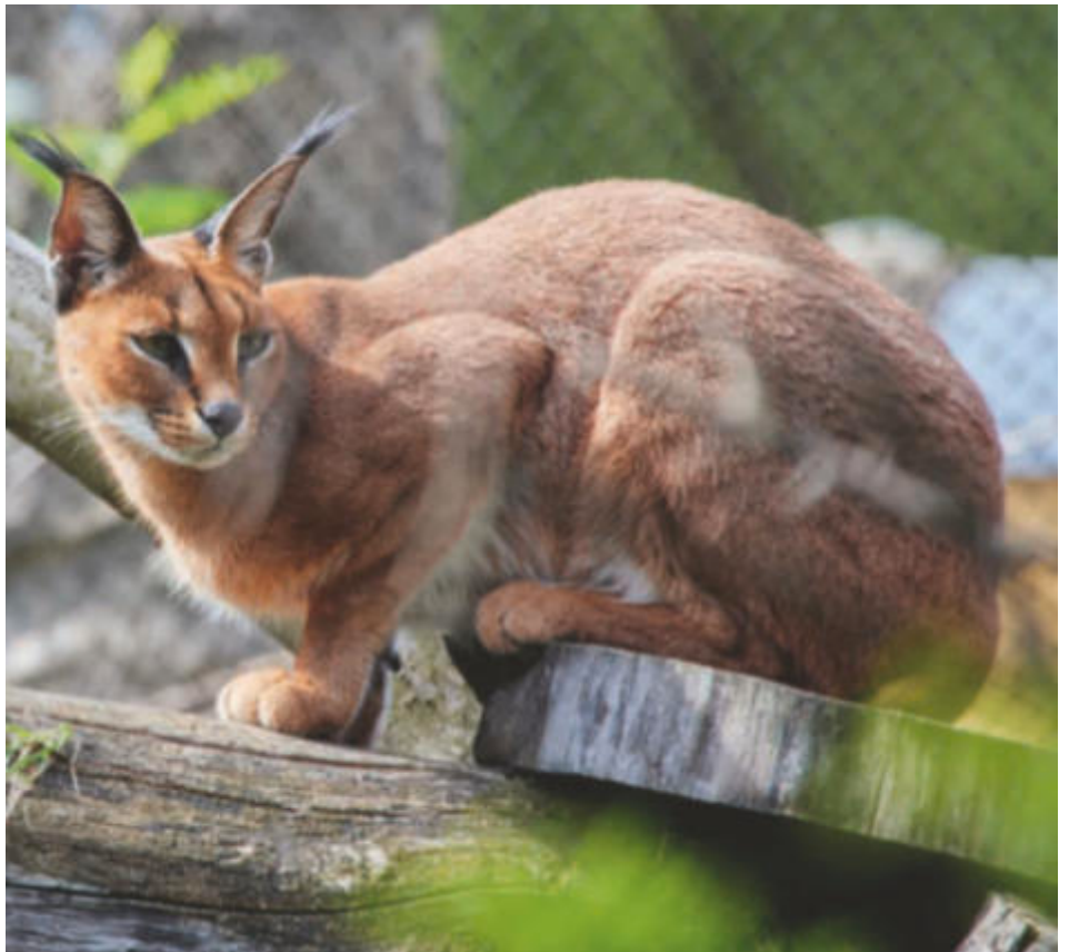
Karakale werden nur noch selten in Zoos gehalten

Im Zentrum der Altstadt, direkt am Schloss, befindet sich der Zoo Hoyerswerda. Auf sechs Hektar Fläche beherbergt er etwa 1.000 Tiere in knapp 130 Arten. Bewohner verschiedener Tierwelten Europa, Asien, Afrika, Südamerika und Australien sowie eine Tropenhalle mit Kubakrokodil, Nashornleguanen, Teufelsrochen und Zwergflusspferden gibt es bei einer „kleinen Reise um die Welt“ zu entdecken. Der Zoo Hoyerswerda ist der kleinste Tierpark des Programms und wird zum ersten Mal vom Zoo-Verein besucht.