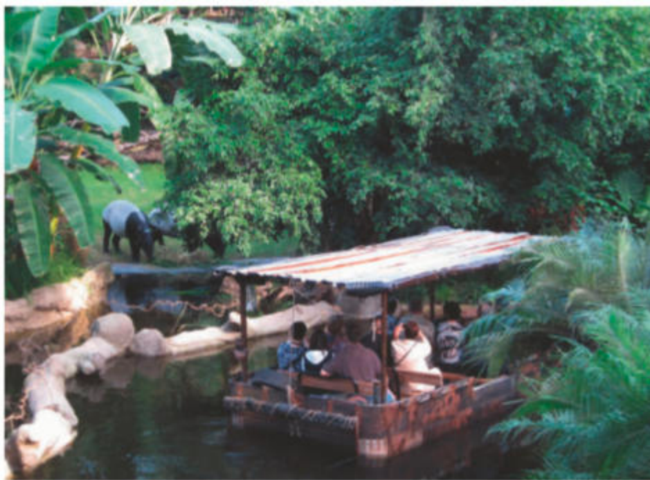
Bootsfahrt entlang der Tapiranlage in Gondwanaland im Zoo Leipzig