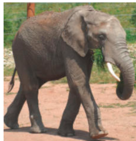
Wiedersehen mit Kibo

In Dresden warten im 1861 eröffneten und damit viertältesten Zoo Deutsch-