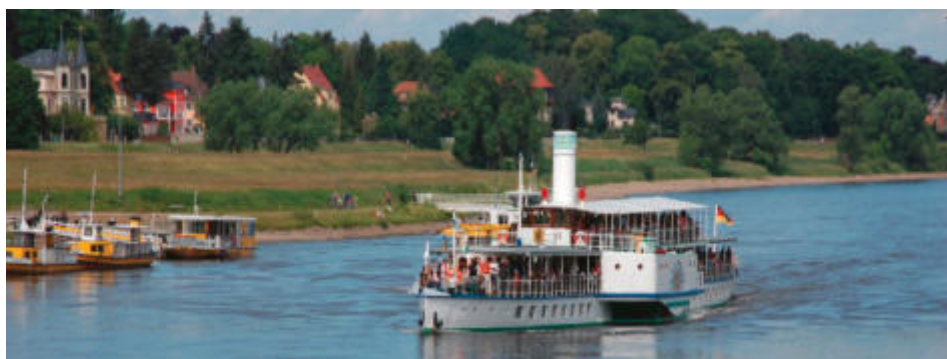
Bootsfahrt über die Elbe